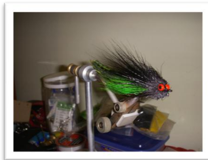
Mosca terminada en Negro/Verde