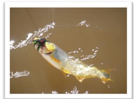
Misma mosca con doradillo en el Arroyo