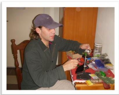
Atando mosca por la noche

Si tiene la posibilidad no dude en los meses de Sept., Octubre y Nov. en hacer una salida por los pesqueros mencionados del Paraná Inferior, mas considerando que son lugares muy cercanos a las ciudades y no demandan largos viajes o gastos en exceso. Disfrute de estos Dorados, un entorno natural brillante y cuide el recurso a través de la pesca deportiva.